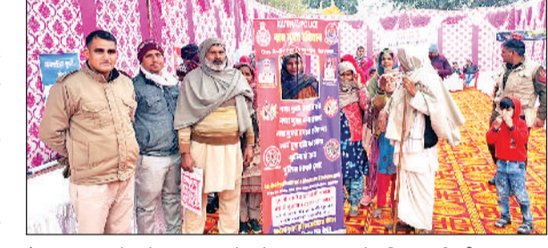
कैथल। गांव कौल में नशा न करने बारे जागरूक करते पुलिस कर्मचारी

हीनता की दृष्टि से देखता है। इसलिए किसी को किसी प्रकार के नशे की लत में नहीं पड़ना चाहिए। विद्यार्थी वर्ग को पढाई व खेलों में ध्यान लगाकर मेहनत करके राष्ट्र निर्माण में योगदान करना चाहिए। पुलिस विभाग द्वारा नशा करना वाले व्यक्तियों की भी काउंसलिंग करवाई जा रही है। पुलिस द्वारा उनका नशे छुड़वाने के लिए हर