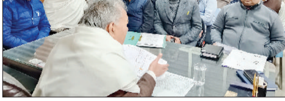
कैथल। सीवन में लोगों की समस्याएं सुनते हलका गुहला विधायक ईश्वर सिंह

कसर नहीं छोड़ी जाएगी। सीवन के सामुदायिक स्वास्थ्य केन्द्र के भवन को जल्द ही शिफ्ट किया जाएगा और पुराने भवन को गिरा कर वहां पर नया अस्पताल बनाया जाएगा। इसका कार्य बहुत ही जल्द आरंभ होगा। उन्होंने कहा कि सीवन की फिरनी का कार्य भी आरंभ होने जा रहा है। कैथल पटियाला मुय मार्ग से सोसायटी बैंक, पटवार भवन होते हुए आगे की सड़क का निर्माण इसमें करवाया जाएगा।