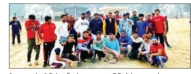
कैथल। राजौड़ में विजेता टीम के साथ मुख्य अतिथियों के साथ आयोजन।