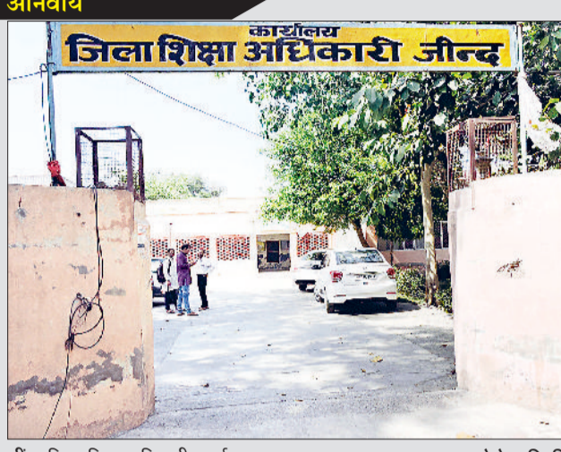
जींद। जिला शिक्षा अधिकारी कार्यालय।

लॉटरी ड्रा के बाद मुख्य सूची में सफल छात्रों द्वारा निर्धारित तिथि तक दाखिला नहीं लेने पर उनकी रिक्त सीटों पर प्रतीक्षा सूची के छात्रों के दाखिले 15 अप्रैल तक होंगे। दाखिला अवधि में जिला मौलिक शिक्षा अधिकारी संबंधित विद्यालय में विभागीय नोमनी नियुक्त करेंगे। इसके लिए वह विद्यालय के नजदीक के खंड शिक्षा अधिकारी, सरकारी विद्यालय के किसी प्राचार्य, मुख्याध्यापक, पीजीटी अध्यापक में से किसी एक को नियुक्त किया जा सकता है।