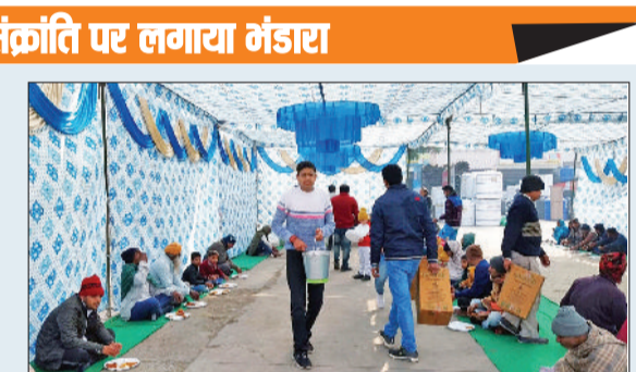
उद्याना। पुरानी मंडी में लगा भंडारा।