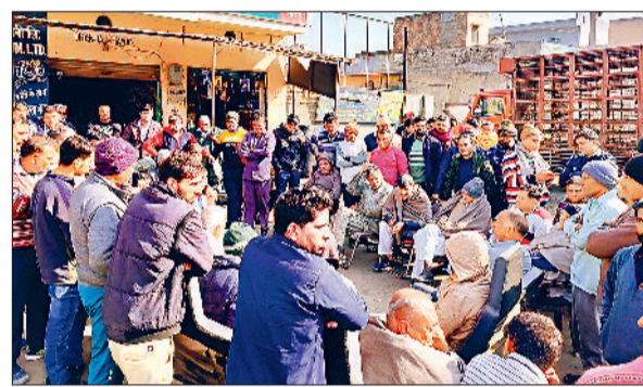
जींद। बैठक करते हुए दुकानदार।