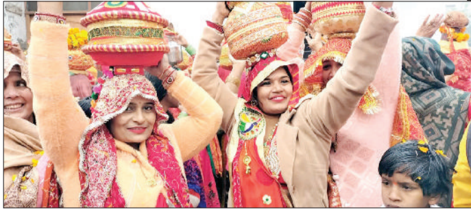
जीद। पूजित अक्षत कलश यात्रा में नृत्य करती महिलाएं।