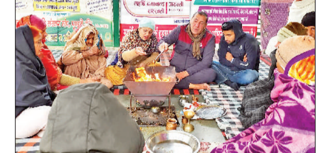
कैथल। पूंडरी मकर संक्रांति के मौके पर आयोजित हवन में आहुति डालते हुए।

कसर नहीं छोड़ी जाएगी। सीवन के सामुदायिक स्वास्थ्य केन्द्र के भवन को जल्द ही शिफ्ट किया जाएगा और पुराने भवन को गिरा कर वहां पर नया अस्पताल बनाया जाएगा। इसका कार्य बहुत ही जल्द आरंभ होगा। उन्होंने कहा कि सीवन की फिरनी का कार्य भी आरंभ होने जा रहा है। कैथल पटियाला मुय मार्ग से सोसायटी बैंक, पटवार भवन होते हुए आगे की सड़क का निर्माण इसमें करवाया जाएगा।