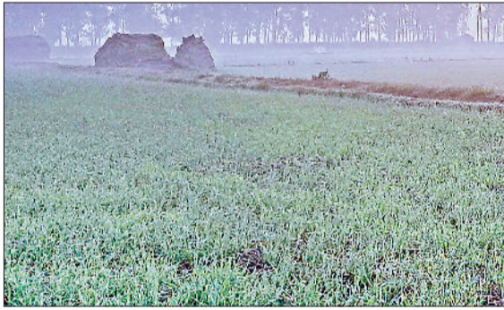
जींद। खेत में खिली हुई फसल।