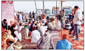
जीद। धरना देते हुए चालक।