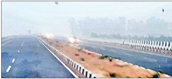
जींद। सुबह के समय एक-दूसरे के पीछे लाइट जलाकर चलते हुए वाहन।

कड़ाके की ठंड का सितम लगातार जारी है। बीती रात घना कोहरा तथा धुंध छाई रही। रात का तापमान भी काफी कम रही। रविवार को दिन भर धूप खिली रही। मौसम शुष्क तथा साफ बना रहा। बावजूद इसके ठंड से कंपकपी छुटती रही। हालांकि अधिकतम तापमान में कुछ इजाफा हुआ लेकिन न्यूनतम तापमान में गिरावट दर्ज की गई। लोगों को खिली धूप का आनंद लेते देखा गया। रविवार को अंतिम तापमान 14 डिग्री तथा न्यूनतम तापमान तीन डिग्री दर्ज किया गया। मौसम में आद्रता 65 प्रतिशत तथा हवा की गति दस किलोमीटर प्रति घंटा दर्ज की गई। मौसम विभाग के अनुसार फिलहाल ठंड से राहत मिलने के कोई आसार नहीं हैं। किसान फसलों की निगरानी बनाए रखें। धुंध तथा कोहरा की संभावना बढ़ गई है। सर्दी के मौसम में इस बार जबरदस्त ठंड पड़ रही है। नव वर्ष में तो कड़ाके की ठंड के सितम ढाह रही है। पिछले चार दिनों से धूप निकल रही है लेकिन ठंड से राहत नहीं मिल रही है। बीती रात घना कोहरा तथा धुंध छाई रही। हालात यहां तक रहे कि सड़कें पूरी तरह सुगन्धित हो गईं। बड़े वाहनों को इंजिन स्टार्ट करके सड़कों के नीचे खड़ा देखा गया। पारा लुढ़क कर तीन डिग्री पर आ गया। घनी धुंध तथा कोहरे का प्रकोप रविवार को भी बना रहा। हवा की गति तेज होने पर कोहरा तथा धुंध छटी।